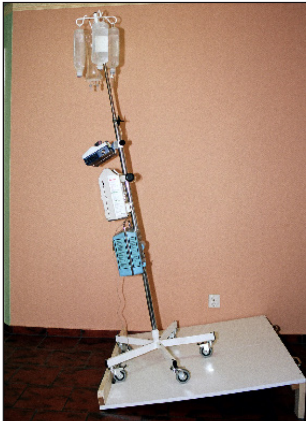
Bilder av testutrustning och -förfarande

Stativet förses med minst den belastning det är avsett för i form av droppåsar och infusionspumpar. Stativet placeras på en platta med 10 graders lutning. Höjden från golv till krokar är 2 meter om inte annat specifikt anges.