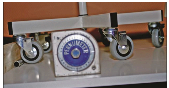
Bilder av testutrustning och förfarande.