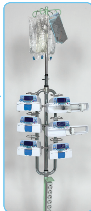
Sofie med utrustning.