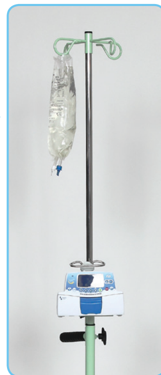
Eva med utrustning