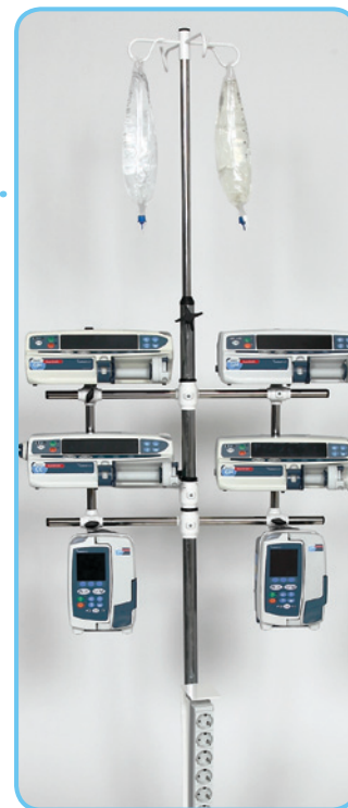
Elsa med utrustning.